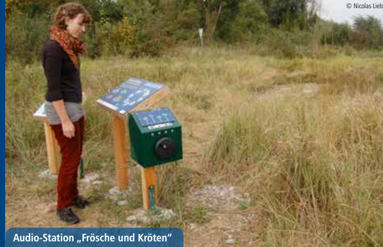
Audio-Station „Frösche und Kröten“